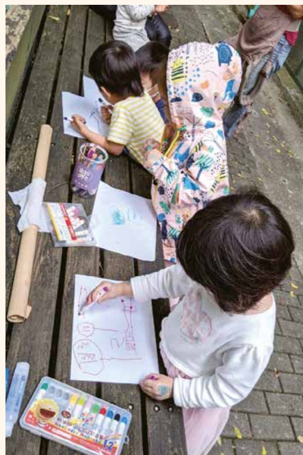
共學的小朋友用塗鴉表達共學最喜歡的內容、最有印象的事。