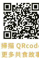
掃描 QRcode 更多共食故事