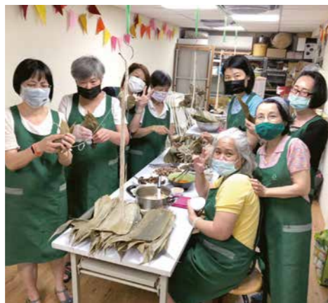
信義區會委員在共作開始前完成場佈任務，圖為粽子共作課。