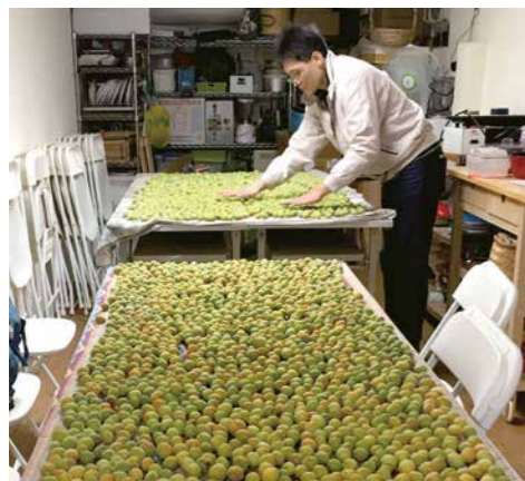
信義站假日班青梅共作課，社員攜家帶眷一起幫忙揀選青梅。