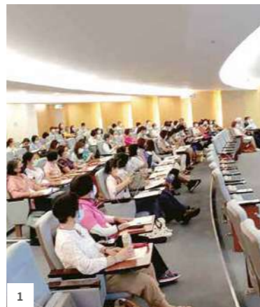
1 今年社代大會於張榮發基金會舉辦。

然而從近5年的趨勢看來，本社有效社員人數和新入社人數逐年下滑，社員年齡往高齡區移動，已經出現了組織老化的警訊，共同購買必須有更多的人加入，才能發揮更大的社會影響力。2020年，請邀請更多人加入我們，一起實現幸福、永續的願景！