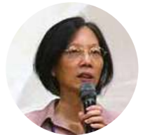
文／李修璋 · 第7屆理事主席 資料來源／2020社員代表大會手冊

共同關注資源永續利用及減廢 2020年開春的新冠肺炎疫情，打亂了日常節奏，本社的社員代表大會首次延到7月舉行，會議主旋律，從永續目標的實踐開始，再接續提案的討論。