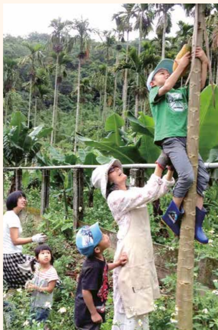
華德福農耕共學，6歲的孩子爬高高採下木瓜與大家分享。