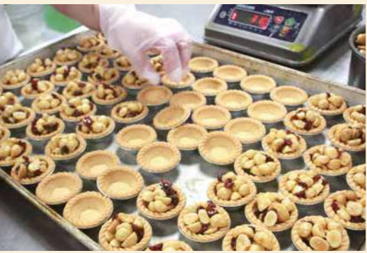
夏威夷豆塔秤重填餡。

提供社員賞鮮的品項，還有嚴選堅果和蔓越莓製作的核桃塔、夏威夷豆塔，經過低溫烘烤後的核桃與夏威夷豆，口感自然香脆，拌入少許麥芽糖填入自製塔皮，兼具味蕾層次，亦保留堅果的完整營養。