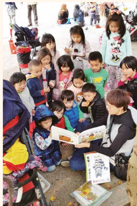
開放空間的共學，只要有媽媽爸爸拿起書說故事，就會有孩子靠過來專心聽。