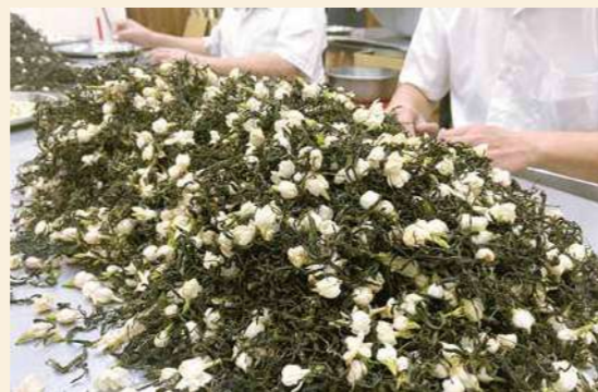
傳統窰製工法製茶，讓茶葉吸附自然花香，過程繁複。

以茶葉窰製而成的茉莉花茶，不掩蓋清香、能平衡味覺，用來搭配糕餅正好。循線找到茶香的源頭，彰化縣花壇鄉茉莉花產量占全台9成，位居全台之冠，有感於進口茶廉價競爭，在地茉莉花產業日漸式微，花壇鄉農會自2013年開始，積極推動茉莉花有機轉型。