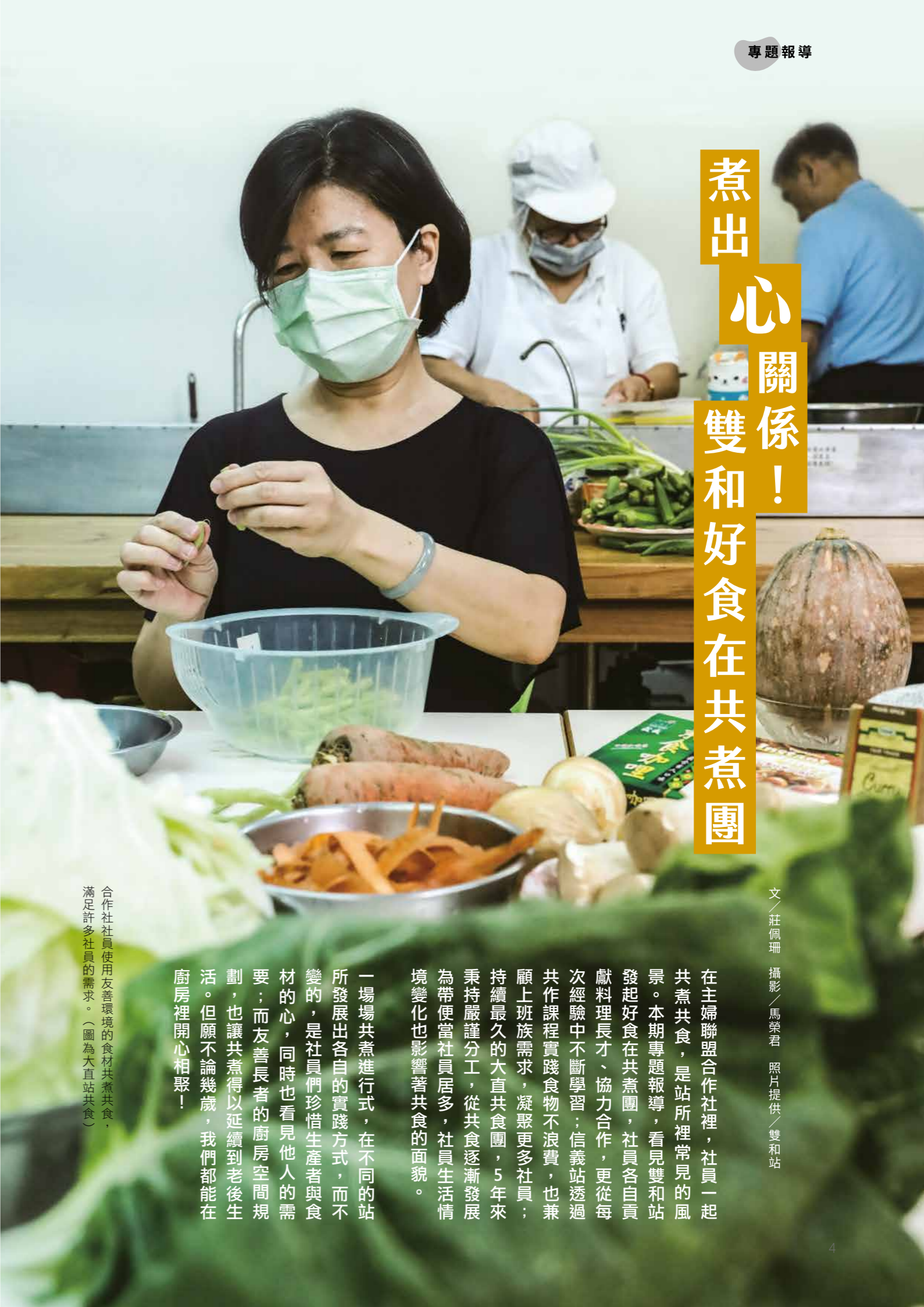
文／莊佩珊

在主婦聯盟合作社裡，社員一起共煮共食，是站所裡常見的風景。本期專題報導，看見雙和站發起好食在共煮團，社員各自貢獻料理長才、協力合作，更從每次經驗中不斷學習；信義站透過共作課程實踐食物不浪費，也兼顧上班族需求，凝聚更多社員；持續最久的大直共食團，5年來秉持嚴謹分工，從共食逐漸發展為帶便當社員居多，社員生活情境變化也影響著共食的面貌。